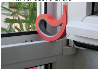
dokonce bez parapetů