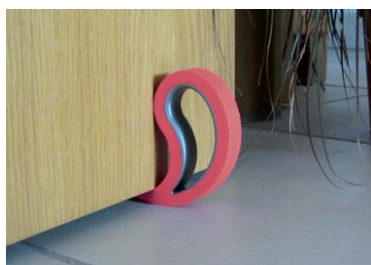
na vchodové dveře